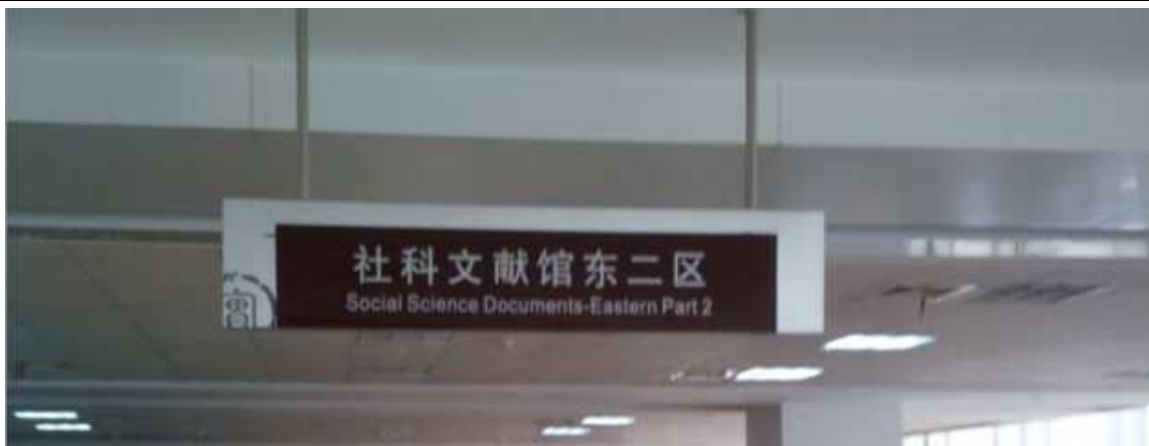
找到索书号所在的分类区间，如下图